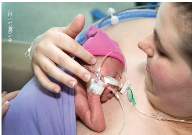
Sve prijevremeno rođene djevojčice i dječaci moći će provoditi vrijeme u bliskom kontaktu s roditeljima, što doprinosi bržem oporavku.